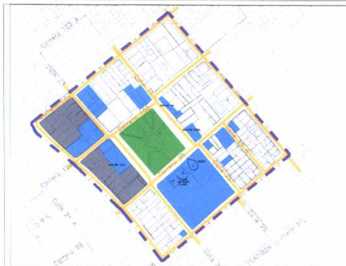
Inmuebles de Interés Cultural - MORFOLOGÍA EN PLANTA