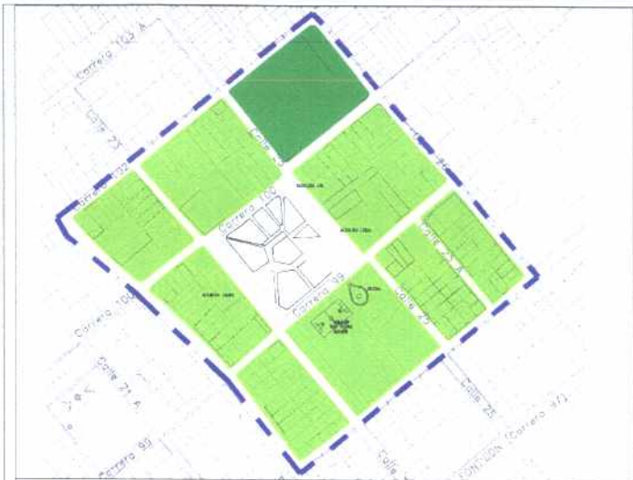
CRECIMIENTO HISTÓRICO - CRONOLOGÍA